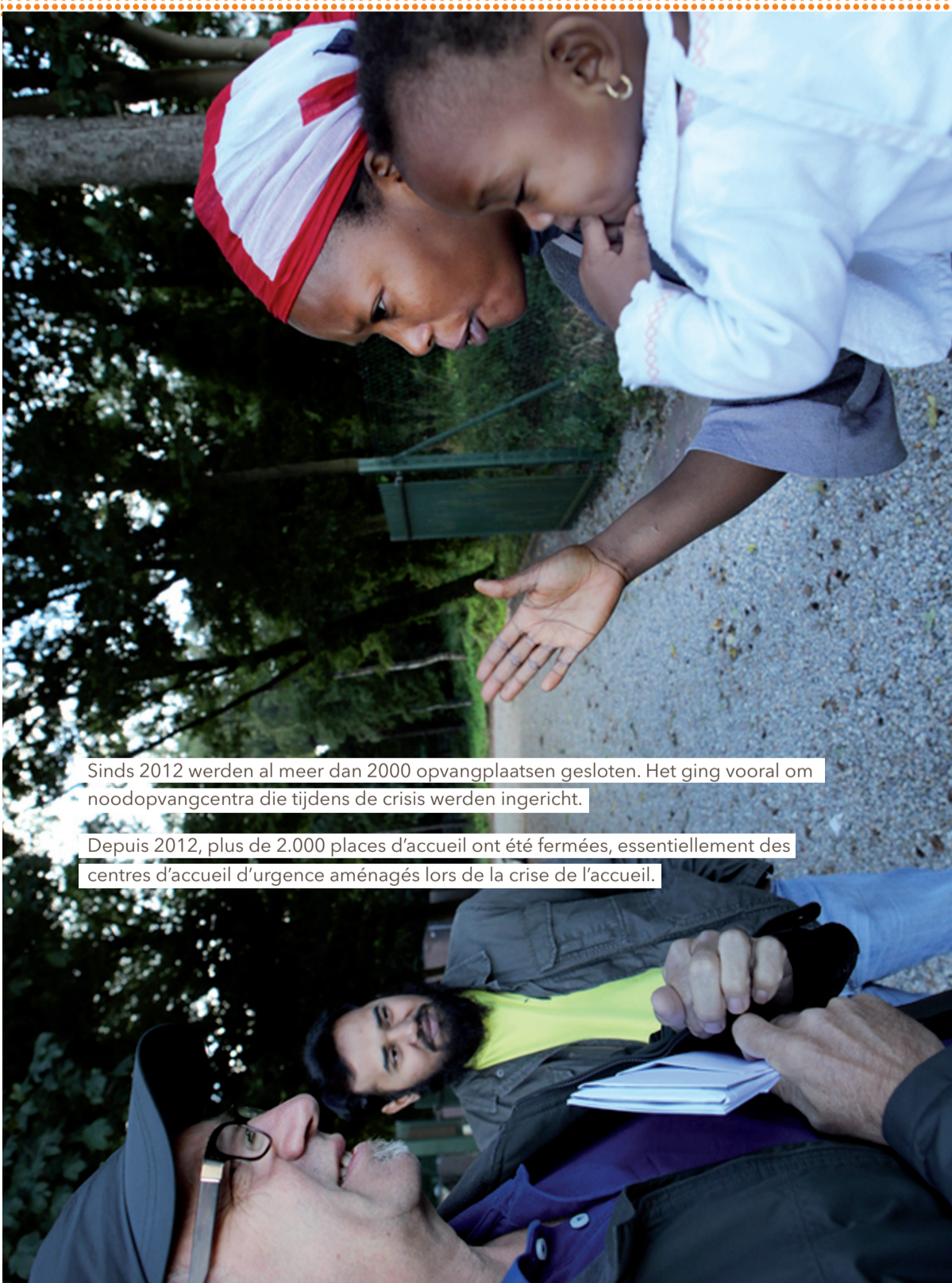
Sinds 2012 werden al meer dan 2000 opvangplaatsen gesloten. Het ging vooral om noodopvangcentra die tijdens de crisis werden ingericht.

Plus d'infos sur l'accueil des demandeurs d'asile : www.fedasil.be