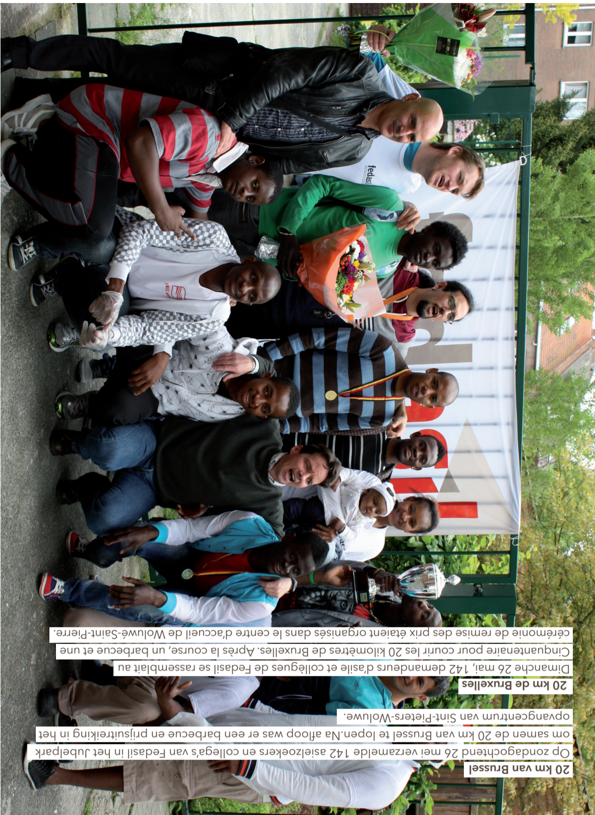
20 km van Brussel Op zondagochtend 26 mei verzamelde 142 asielzoekers en collega's van Fedasil in het Jubelpark om samen de 20 km van Brussel te lopen. Na afloop was er een barbecue en prijsuitreiking in het opvangcentrum van Sint-Pieters-Woluwe.