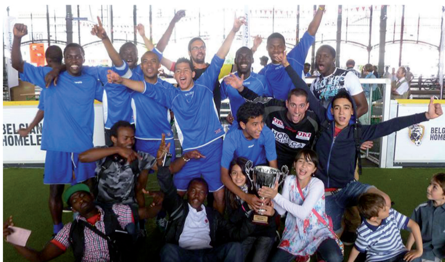
Le 2 juillet, le centre d'accueil de Woluwé-Saint-Pierre a remporté la célèbre homeless cup, un tournoi de football pour les sans abri.

Op 2 juli won het Fedasil opvangcentrum van Sint-Pieters-woluwe in Anderlecht de befaamde homeless cup, een voetbaltoernooi voor daklozen.