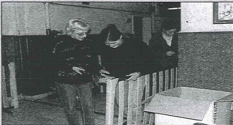
De eerste personeelsleden van het asielcentrum zorgen voor de binneninrichting van de lokalen.

om te komen werken in het asielcentrum», verklapt ze. «Nu draaien we nog shiften van acht uur, maar éénmaal de vluchtelingen arriveren, kloppen we twaalf uur. We hebben hier nog veel werk voor de boeg voor de deuren definitief opengaan. We moeten alle lokalen nog kuisen.» – LXB